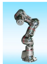
医療・薬品用ロボット (2013年)