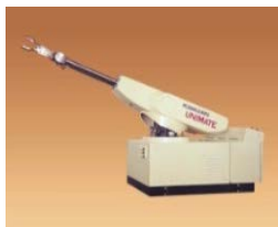
国産初の産業用ロボット (1969年)