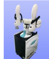
双腕ロボット duAro (2015年)