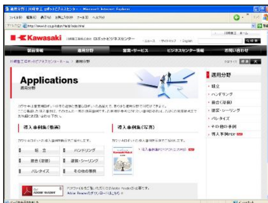
(ウェブサイトの適用技術のページ)

産業用ロボット40年の歴史の中で培ったカワサキのロボット適用技術はありとあらゆる分野に及びます。このたび、その一部を当社のウェブサイト上で新たに公開しています。組立、ハンドリング、接合(溶接)、塗装・シーリング、パレタイズ、その他に分類し、各分野に数点、合計60もの適用事例のビデオを掲載しました。 これらの適用事例はカワサキの実績のほんの一部ですが、皆様の自動化、省力化などのご計画にご参考になればと思います。WEBで公開していない(または出来ない)適用も多数ありますので、お近くの営業所にコンタクトをしていただければ、ご相談に応じることができます。 当社WEBサイトはこちらです。 http://www.khi.co.jp/robot/field/index.html